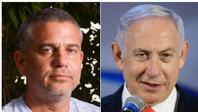
בנימין נתניהו, יו"ר מנדל

ערוץ 14 שובר שיאים עם ראש הממשלה בנימין נתניהו. לראשונה אי פעם, נתניהו הגיע לאולפן 'הפטרוויזים' של ינון מגל אין ספק שמלבד ראיון מעניין במיוחד היה גם רגע אחד בלתי צפוי, כאשר השידור קרס למשך קרוב לדקה ולא ניתן היה לצפות בחלק קטן ממנו. ולמרות האירוע, הערוץ הצליח לשוב את שיא הרייטינג של עצמו.