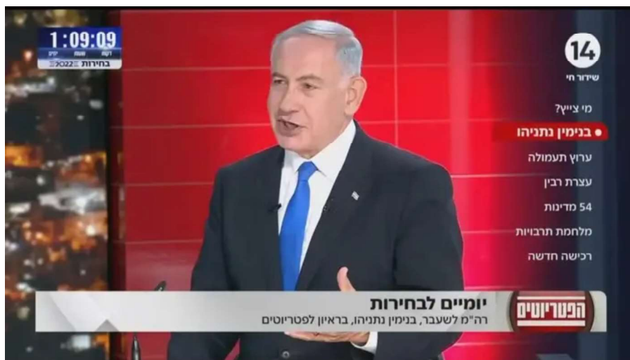
נתניהו בתוכנית הפטריוטים, ערוץ 14

מוקדם יותר היום הודיעה ועדת המדרוג כי כשלוש שנים אחרי שפרש ממנה, ערוץ 14 צפוי לחזור ולהימדד . על פי ההסכם, בקרוב תחל הוועדה לפרסם את נתוני הצפייה של הערוץ יחד עם שאר הערוצים.