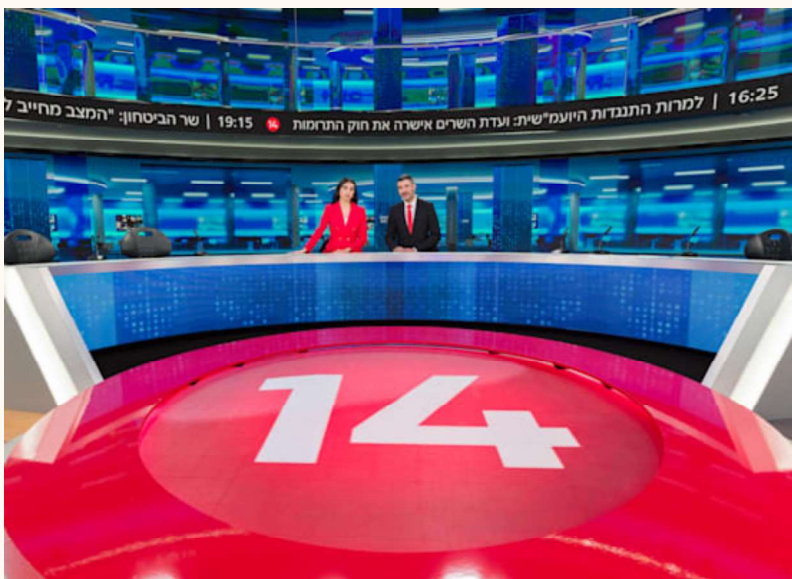
אולפן חדשות 14

"תוכנית חיסכון" עם קרן מרציאנו בקשת 12 גרפה 9.3% רייטינג, "אזור בחירה" עם רביב דרוקר ברשת 13 לקחה נתח של 5.8%, התוכנית החדשה של אילה חסון בתאגיד רשמה 6.3%, ויעקב ברדוגו בערוץ 14 הניב 4.2% צפייה. נציין כי מדובר ברייטינג בקרב משקי בית יהודיים (עליו מתבסס שוק הפרסם בתמחור פרסומות).