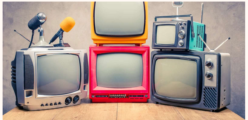
שוק הטלוויזיה